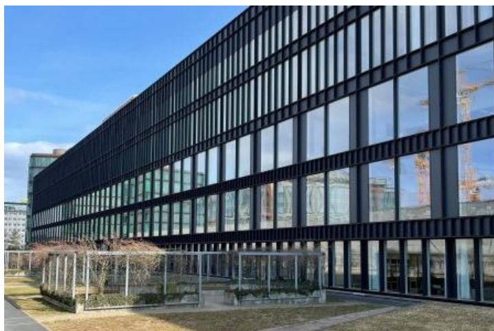
KB 32 (kammeradvokaten) - pulverlakeret af Vilak / Dancolor

Der er begrænset pladser med først-til-mølle-princippet gældende