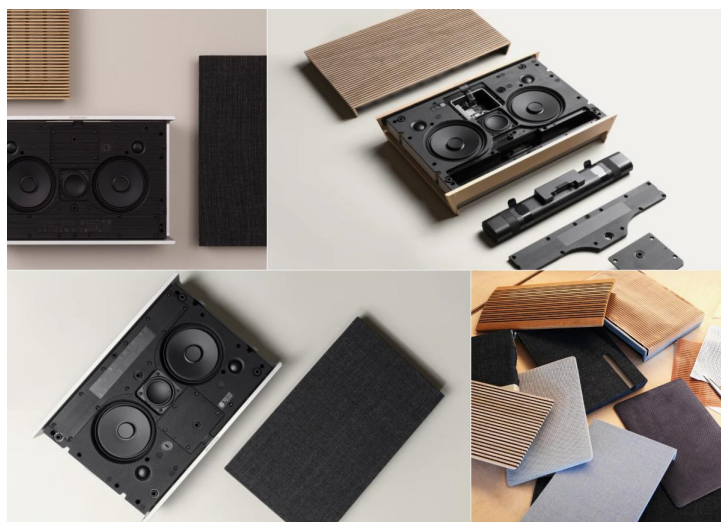
Beosound Level, ref Bang & Olufsen

Da der er et begrænset antal pladser, gælder først-til-mølle-princippet