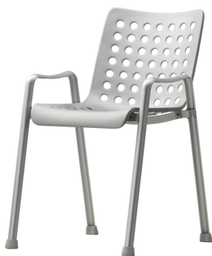
Landi Chair, 91 huller i alu-sæde og stel af aluminium

Aluminium er et fantastisk materiale - det kan formes til det ønskede design, det er et let materiale, det er vedligeholdelsesfrit og ikke mindst er det 100% genbrugsvenligt og energiforbruget meget lavt ved genbrug.